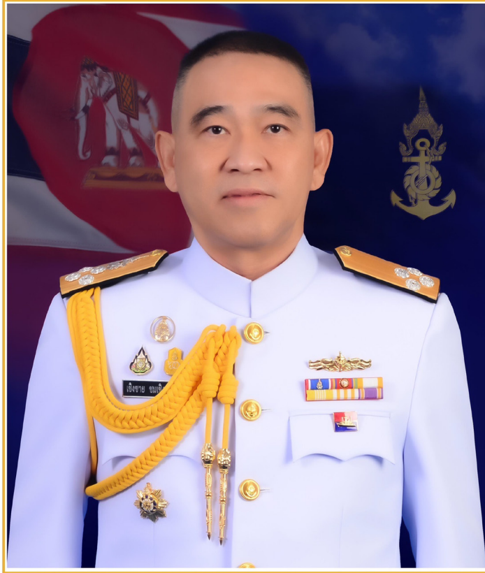
พลเรือเอก เชิงชาย ชมเชิงแพทย์ ผู้บัญชาการทหารเรือ