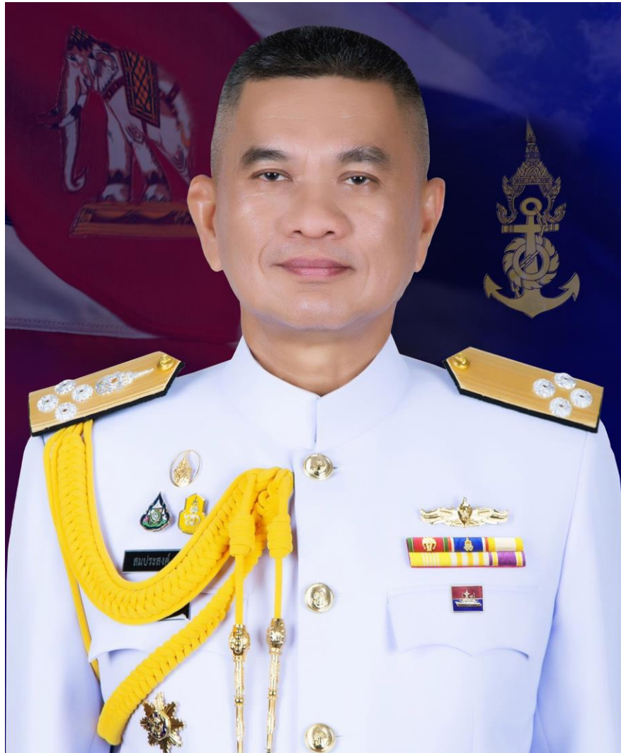
พลเรือเอก สมประสงค์ นิลสมัย ผู้บัญชาการทหารเรือ